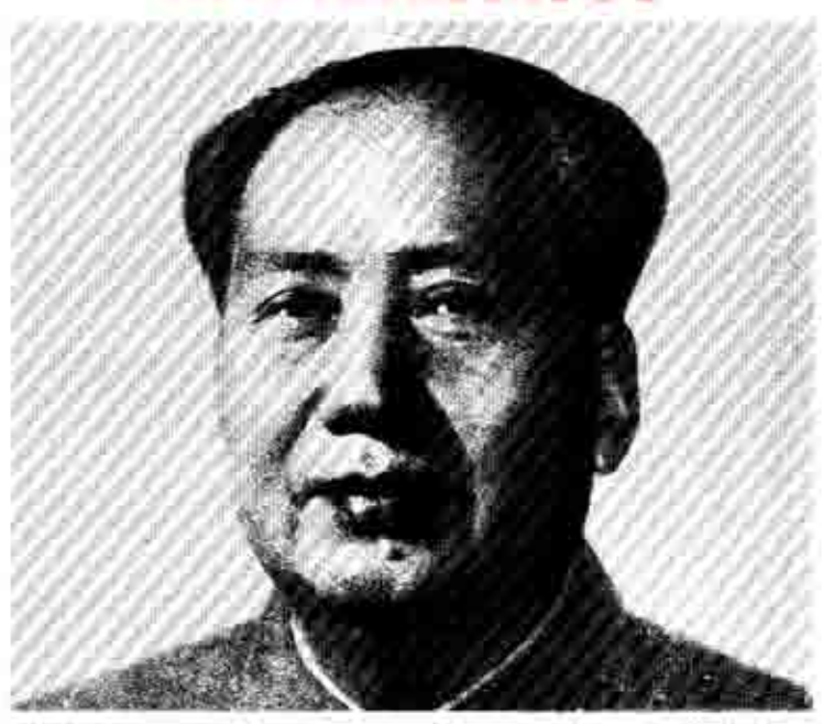
TO BOYNG MOYHAN Oxtropone 1935

YACHUA. κοιτάμε τις αγριόχηνες να εξαφανίζονται