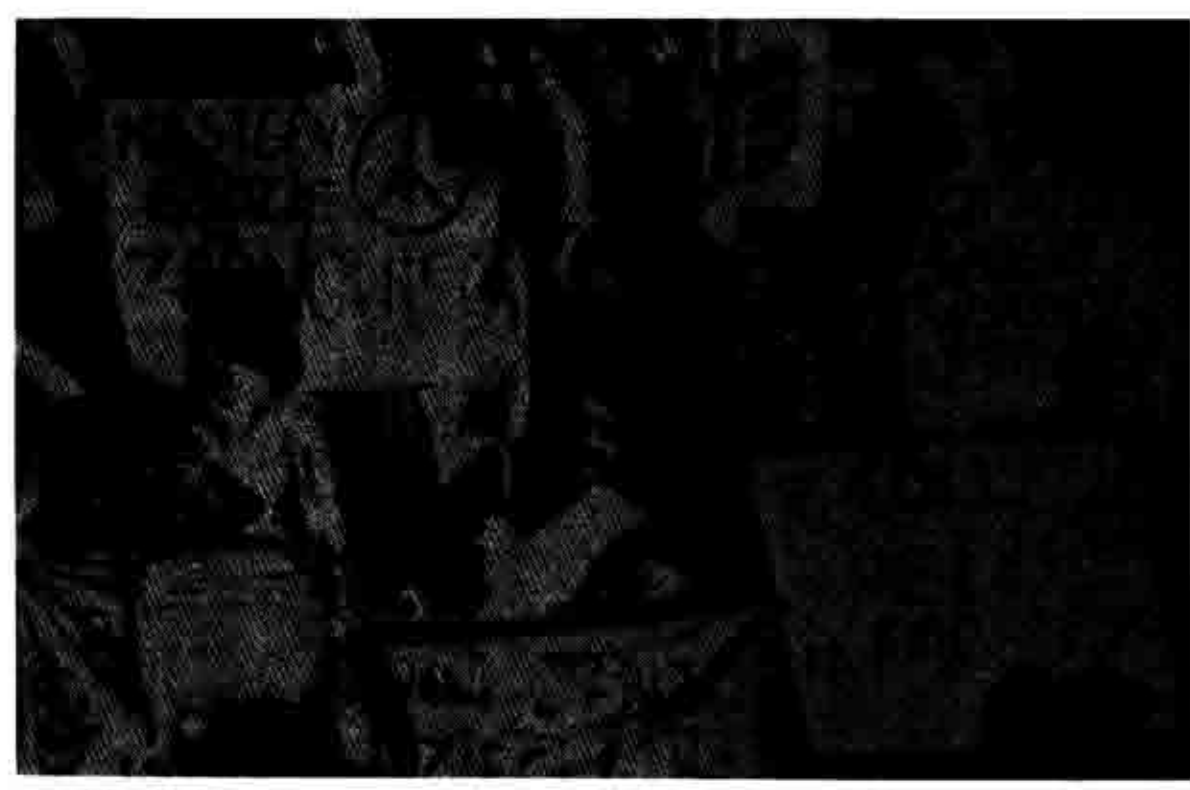
Aladoredon stalledores ovartia sta eguinga tur Porde

Παρ΄ όλες τις προσπάθειες των ρωσικών ηγετών, διαστρειλώνουν την αλήθεια. Ύψου από τις αιτίες που προκάλεσαν το «ατύχημα» την βλέπουν, ερχεται στην επιφάνεια με μια ασταματητή δύναμη. Τα γεγονότα και μόνο που πηγάζουν από τα στοιχεία που είναι διαθέσιμα από τις ρώσικες επίσημες πινές μιλάνε μόνα τους.