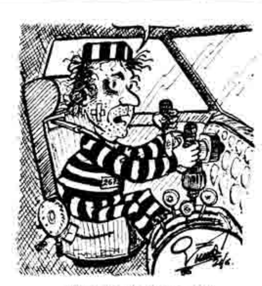
Ολυμπιακή Αμνηστία. (Τής Βάσως Χουσικάκη)

Φαίνεται πως αυτή η εθνικιστική έξαρση δεν έφτανε. Γι' αυτό επιστρατεύθηκαν όλα τα «νόμιμα» «εθνικά» μέσα, όπως οι φυλακίσεις αυτών των «εγκληματιών» πιλότων, που τόλμησαν να απειθαρχήσουν στο «έθνος». Ετσι οι απεργοί της Ολυμπιακής «πείστηκαν» μετά απ' αυτά και αφού απόκτησαν «εθνική συνείδηση», έλυσαν την απεργία τους.