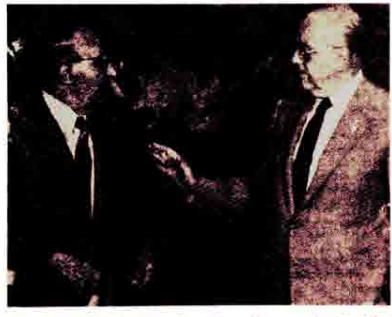
Παπονδρέου με τον . Ζίβκοφ λίγο πριν αρχίσει η κοινή συνέντευξη

Η παλιά Δεξιά, παρά τις όποιες «φιλελευθεροποιήσεις» της και τους «πατριωτισμούς» της δεν μπορεί να κρίψει τον αντιδραστικό της χαραχτήρα. Έτσι όπως την γνώρισε ο λαός μας από παλιά, γεμάτη εθνικές προδοσίες και ξεπουλήματα, υπηρέτη της αμερικάνικης υπερουναμης Ο Μητσοτακής συνεχίζει την ίδια παράδοση. Η δε όξυνση του ανταγωνισμού των υπερδυνάμεων στη χώρα, τον αναγκάζει όλο και πιο πολύ να συμπορεύεται με τον Τούρκικο επεγτατισμο. Οι «διαβεβαιώσεις» του πως η στρατοκρατική κλικα της 'Αγκυρας δεν έχει επεχτατικές βλέψεις σε βάρος οποιασδήποτε περιοχής περιλαμβανομένης και της Κύπρου» δείχνουν τον ράλα του.