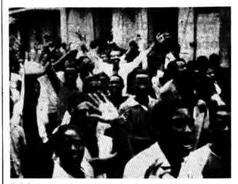
Οι διαδηγώσεις του μαύρου πληθεσμοί από την Καπ Αιτικί, πόλη που ήται το κείτρο της φεξειρσης είταιτα στο καθέστως Ατυραλή.

Η χώρα που το κατά κεφαλή εισόδημα είναι 100 δολ. τον χρόνο, που ο αναλφαβητισιμός φτάνει στο 80% του πληθυσμού που οι άνθρωποι πεθαίνουν στα 45 τους, η χώρα της πιο μαύρης δικτατορίας, όπως ονομάστηκε, των αιώνιων δικτατόρων της οικογένειας Ντυβαλιέ, δοκίμασε πριν λίγες μέρες, την έκρηξη ενός ηφαίστειου. Του μαύρου πληθυσμού. Το Πόρτ - Ω - Πρενς και το Κάπ Αϊτιέν έγιναν πεδία αναταραχής και αιματηρών συγκρούσεων, ανάμεσα στην εξεγερμένη μαύρη πλειοψηφία, και στους πραιτωριανούς φασίστες Τοντόν Μακούτ του δικτατόρα Ντυβαλιέ.